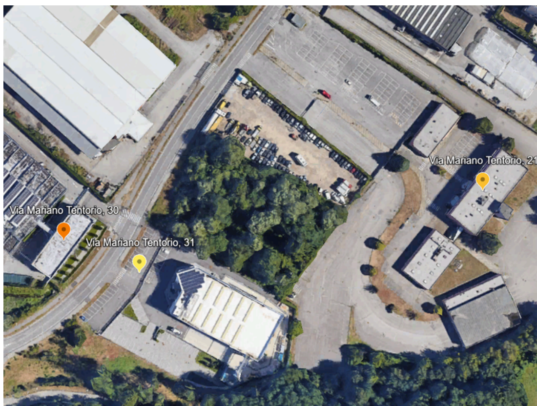
Figura 2 Polo di Via Tentorio (Como)